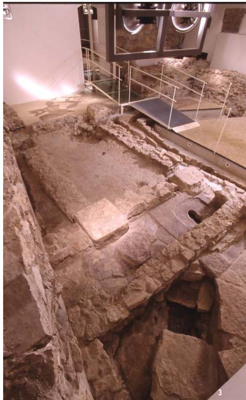
1. Römische Villa in der Via Rosmini. Mosaik mit dem Mythos des Orpheus. 2. und 3. Einige Bilder vom unterirdischen archäologischen Sass-Gelände.