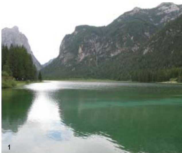
Tabelle informative vi accompagneranno nella lettura dell'ambiente durante il vostro giro del lago, procedendo all'inizio verso sud (1 ora). Attraverserete tratti ghiaiosi, altri fittamente boscosi così come praterie paludose e canneti; infine, passerete sulla diga che chiude l'ultimo lato del lago per ricalcare la via dell'andata. Se poi volete rilassarvi con una gita in barca sul lago, vi si possono noleggiare tranquilli pedalò.