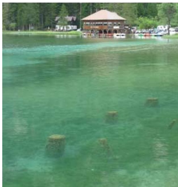
Il Lago di Dobbiaco.

Il punto esatto del confine, dice una leggenda, è il luogo dove due vecchie partite a piedi al canto del gallo, una da Auronzo l'altra da Dobbiaco, si sarebbero incontrate, ma l'auronzana avrebbe svegliato di nascosto il suo gallo anzitempo pungendolo con un ferro da calza e allora... fece più strada dell'avversaria! Le Tre Cime sono composte dalla Cima Grande, che è la centrale (2.999 m), dalla Cima Ovest (2.973 m) e dalla Cima Piccola (2.857 m), la più elegante nelle sue forme slanciate. Il primo a raggiungere la Cima Grande fu il viennese Paul Grohmann nel 1869, conquistatore in quegli anni di molte cime dolomitiche.